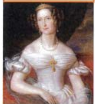
Princesse Anna Pavlovna