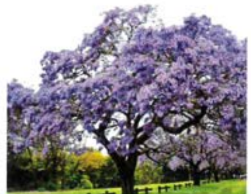
Paulownia Tomentosa, arbre impérial, floral